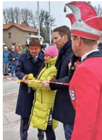
Einweihung der neuen Brücke und des Kreisverkehrs

Nicht nur der Karneval sorgte für gute Laune: Zeitgleich wurde die neue Brücke an der B246n sowie der Kreisverkehr offiziell an die Zossenerinnen und Zossener übergeben. Diese Infrastrukturprojekte sind ein bedeutender Schritt für die Region und wurden gebührend mit in die Feierlichkeiten eingebunden. Am Abend nutzten viele Bürgerinnen und Bürger die Gelegenheit, die neue Brücke erstmals zu überqueren – eine symbolische Geste für Aufbruch und Zusammenhalt.