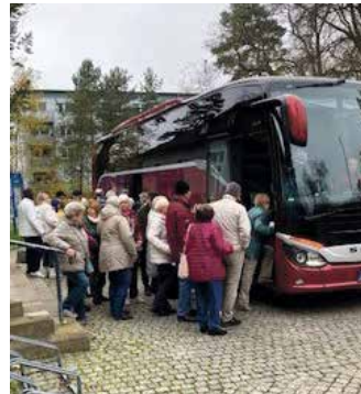
Reger Andrang bei der Kennlern-tour durch Zossens Ortsteile

» Das FaBB der Stadt Zossen veranstaltete zwei „Kennlerntouren übers Land“ durch die Ortsteile der Stadt. Ziel war es, alle Ortsteile mit ihren Besonderheiten vorzustellen und interessante Begegnungsmöglichkeiten, besonders für Senioren, bekannt zu machen. Die Nachfrage war sehr groß, sodass die Karten sehr schnell vergriffen waren.