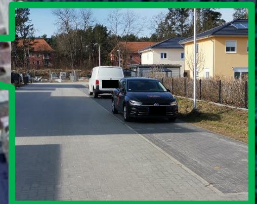
Einrichtung verkehrsberuhigter Bereich, Kiefernring in Waldstadt