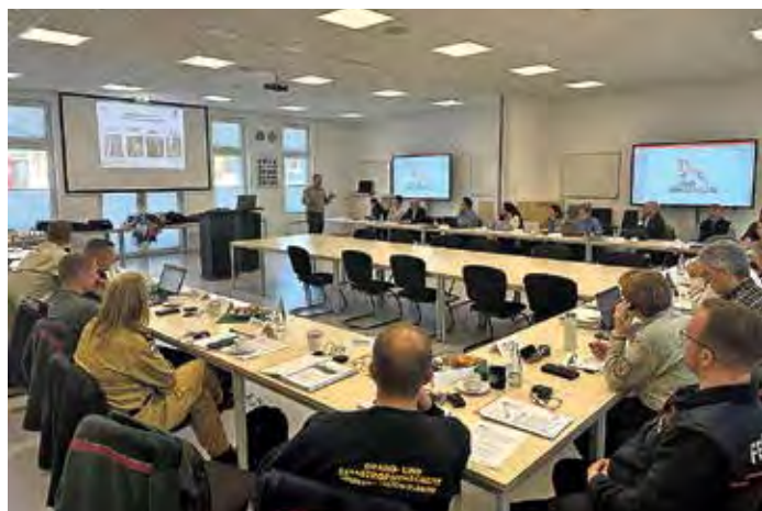
Die Räumlichkeiten in Wünsdorf boten optimale Bedingungen für die Veranstaltung.

Am 22. November 2024 fand im Feuerwehrgerätehaus Wünsdorf ein international besetzter Erfahrungsaustausch zum Katastrophenschutz statt. Anlass war der Wildfire Peer Review, ein Verfahren des EU-Katastrophenschutzes, das Brandenburg 2024 durchführen wird. Ziel des Reviews ist es, bestehende Steuerungs- und Reaktionsmaßnahmen unabhängig zu bewerten und Verbesserungsmöglichkeiten gemäß europäischer Best-Practice-Ansätze aufzuzeigen.