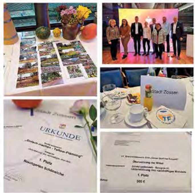
Schöneiche sicherte sich den 1. Platz in der Kategorie „Unterstützung des nachhaltigen Wandels“.

Der Naschgarten ist nicht nur ein Ort, an dem frisches Obst und Gemüse wachsen, sondern auch ein Vorzeigeprojekt für den nachhaltigen Wandel. Er lädt Menschen aller Generationen dazu ein, sich auszutauschen, voneinander zu lernen und gemeinsam die Natur zu erleben. Mit seinem Fokus auf Biodiversität, Gemeinschaft und Nachhaltigkeit passt das Projekt per-