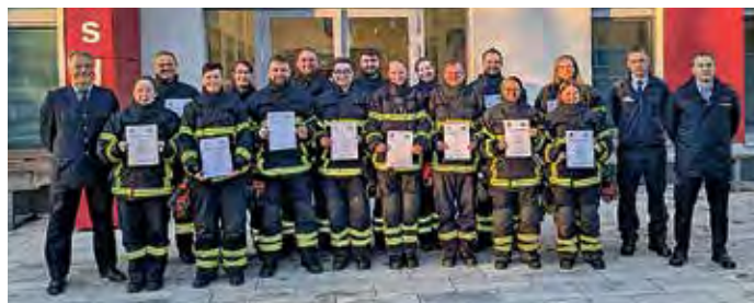
Diese 15 Feuerwehrleute konnten ihre Teilnahmebescheinigungen für die Truppmann-Ausbildung Teil 1 in Empfang nehmen.

Nach einer wohlverdienten Pause geht es für die Kameradinnen und Kameraden Ende Januar schon wieder weiter, dann folgt der zweite Teil der Truppmann-Ausbildung, der Erste-Hilfe-Kurs sowie der begleitende Lehrgang „Sprechfunke“.